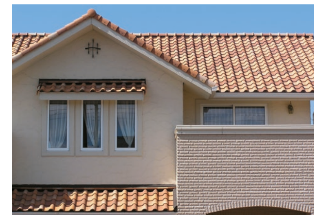
▲ユーロイエロー+ユーロライト+ユーロブレンド 各33%