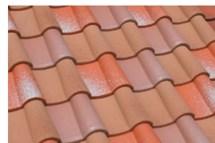
▲ユーロパウダー+ユーロビーチ+ユーロライト