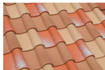
▲ユーロパウダー+ユーロイエロー+ユーロライト