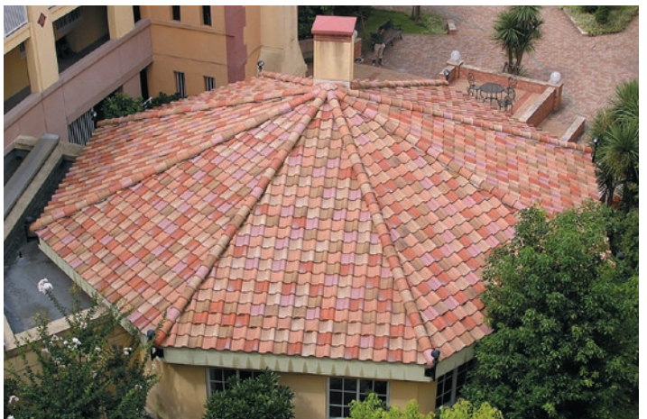
▲ユーロライト+ユーロイエロー+ユーロパウダー+ユーロビーチ+ユーロキャメル 各20%