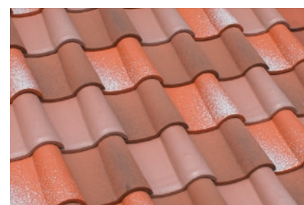
▲ユーロパウダー+ユーロビーチ+ユーロブレンド