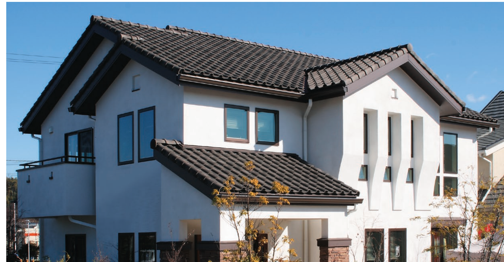
▲ユーロクラシック