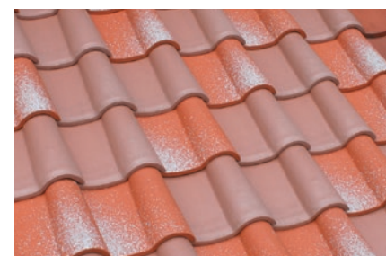
▲ユーロパウダー+ユーロビーチ