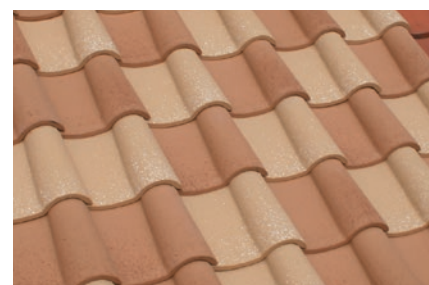
▲ユーロイエロー+ユーロライト