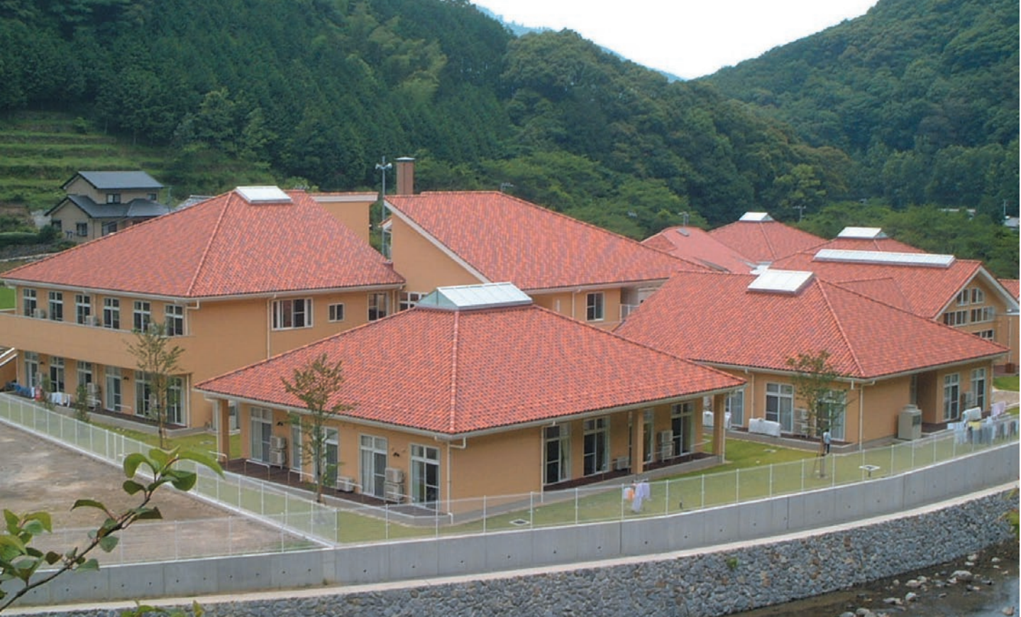
▲スヤキ / 淡+スヤキ調2色(中・濃) 各33%