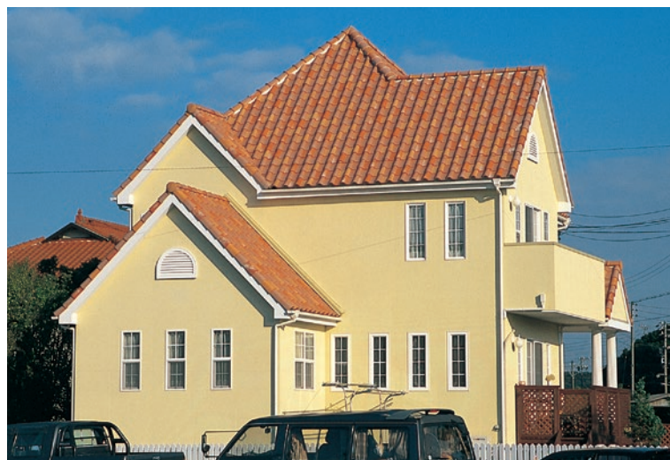
▲ユーロビーチ60%+ユーロパウダー20%+ユーロライト20%

Ceramic.....環境に優しく Economical.....経済的な Reform.....改良する Allround.....万能的に Major.....一流の 21st century.....輝かしい未来