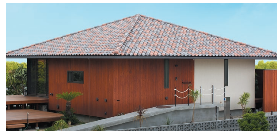
▲ユーログレー+ユーロブレンド+ユーロクラシック