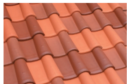
▲スヤキ / 淡+スヤキ調2色(中・濃)