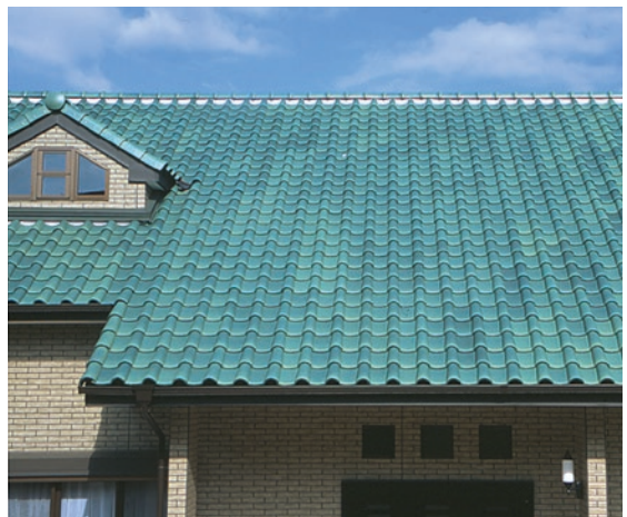
▲アイビーグリーン